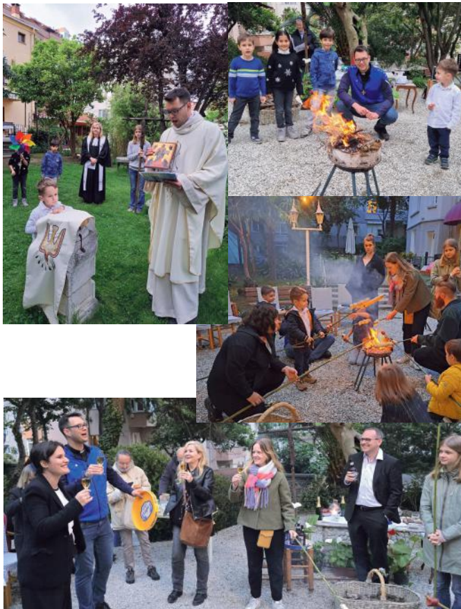
Text & Bilder: St. Paul

Es ist Christi Himmelfahrt. Die Sonne scheint im Garten von St. Paul. Eine ökumenische Gruppe von Kindern, Jugendlichen und Erwachsenen versammelt sich um den Komposthaufen. Dort beginnt eine abenteuerliche Spurensuche, die spielerisch quer durch den Garten führt und an verschiedenen Stationen Impulse setzt, Ostern auf der Spur zu bleiben. In einer Feuerschale brennt das Osterfeuer: Wieder oder immer noch. Die Kernbotschaft von Christi Himmelfahrt: Jesus macht sich auf den Weg in den Himmel – er kehrt zurück zu seinem Vater – aber „er macht sich nicht aus dem Staub.“ – Er bleibt in Ewigkeit bei uns – Das Osterfeuer brennt weiter. Aber es ist gleichzeitig unsere Verantwortung, „das Feuer unseres Glaubens“ am Brennen zu halten. Es braucht Nahrung. Die Kinder rennen los, suchen Holz im ganzen Garten, um das Feuer „zu füttern“. Die Flammen lodern auf. Es ist und bleibt Ostern.